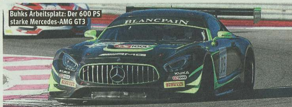
Buhks Arbeitsplatz: Der 600 PS starke Mercedes-AMG GT3

Der Reiz, mit dem Stern auf der Haube um den Titel mitzukämpfen, war einfach zu groß. „Ich hatte im vergange-